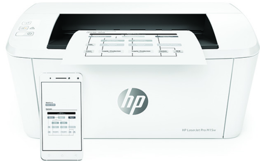
HP LaserJet Pro M15w Drucker

Dynamic-Security-fähiger Drucker. Ausschließlich für die Verwendung mit Patronen mit Original HP Chip vorgesehen. Patronen mit Chips anderer Hersteller funktionieren möglicherweise nicht oder in Zukunft nicht mehr. Weitere Informationen unter: http://www.hp.com/go/learnaboutsupplies