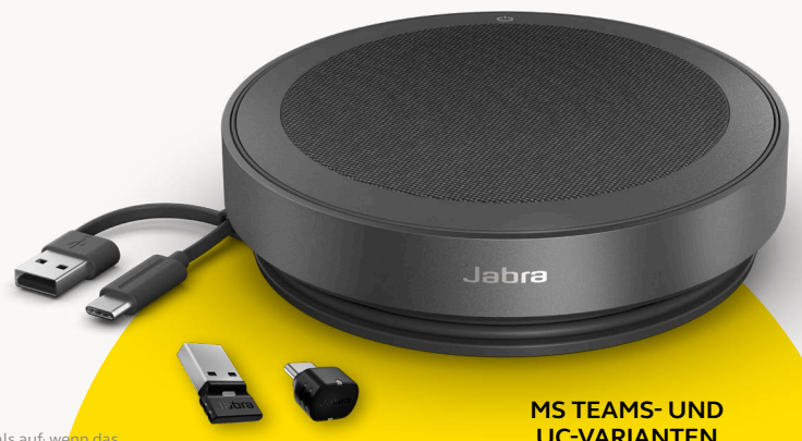
MS TEAMS- UND UC-VARIANTEN

Um unseren Planeten zu schützen, berücksichtigen wir den Aspekt der Nachhaltigkeit in jeder Phase der Produktentwicklung. Deshalb haben wir das Gehäuse der Speak2 75 aus über 33 % nachhaltigen Materialien 3 gefertigt und eine Reihe von Bauteilen integriert, die repariert oder ersetzt werden können. Mehr Nachhaltigkeit bedeutet eine längere Lebensdauer deiner Freisprechlösung – und sorgt für Gespräche in hoher Sprachqualität für dich und dein Team über Jahre hinweg.